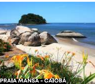
PRAIA MANSÁ - CAIOBÁ