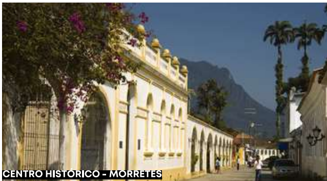
CENTRO HISTÓRICO - MORRETES

Após o almoço, faremos um passeio panorâmico pelo litoral paranaense, visitando os balneários de Caiobá, e Guaratuba.