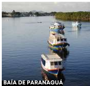
BAÍA DE PARANAGUÁ