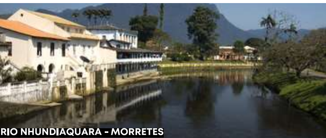
RIO NHUNDIAQUARA - MORRETES