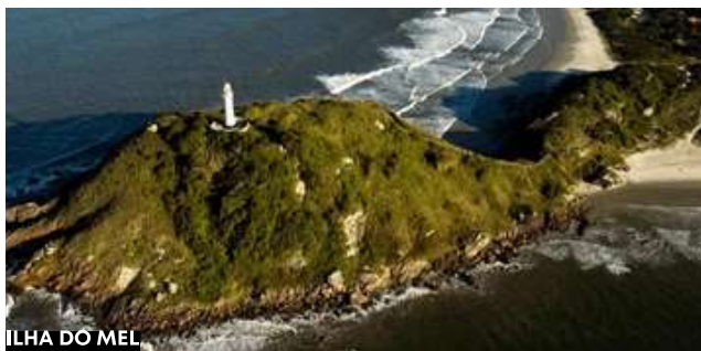
ILHA DO MEL

Após o café, vá até o pier, pegue a barca de retorno para Pontal e, posteriormente, em horário combinado, transfer para Curitiba. Hospedagem e noite livre.