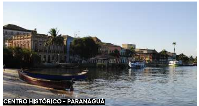
CENTRO HISTÓRICO - PARANAGUÁ

Café da manhã e retorno a Curitiba, em horário a combinar. Chegada em Curitiba, tarde e noite livres.