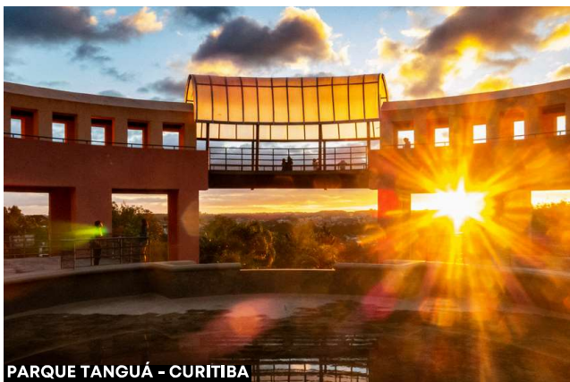
PARQUE TANGUÁ - CURITIBA