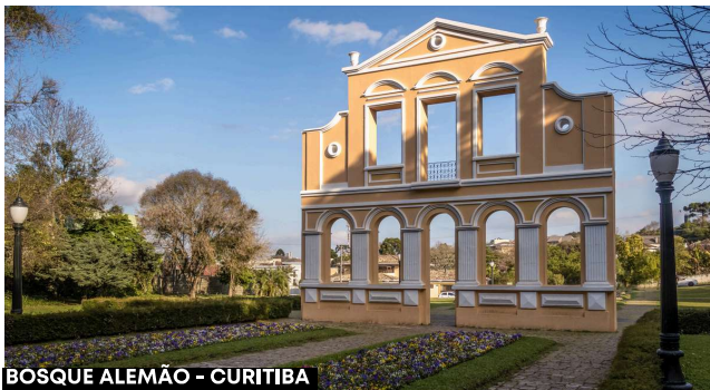
BOSQUE ALEMÃO - CURITIBA

Café da manhã. Quartos devem ser liberados até 11h00. Traslado de saída em horário a combinar.