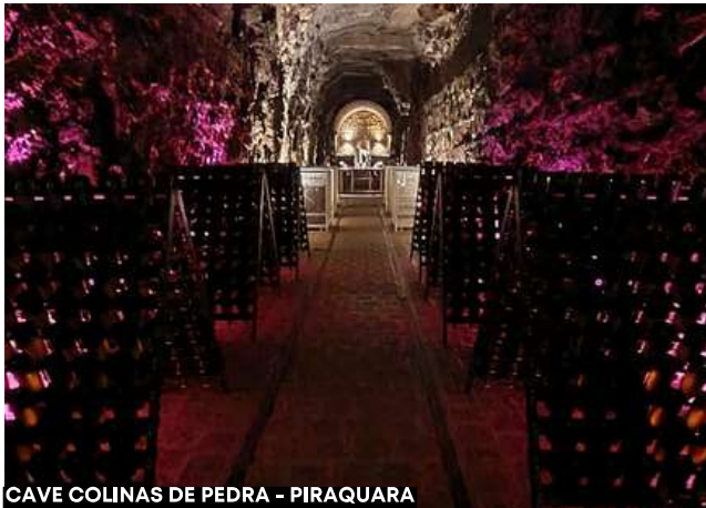
CAVE COLINAS DE PEDRA - PIRAQUARA

Ao chegar na Colinas de Pedra, será feita uma visita guiada pela área e degustação rótulos selecionados. Após o almoço será servido (incluído), finalizado o almoço, tempo livre relaxar no local. Final do dia, retorno para o hotel e noite livre.