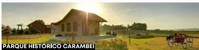
PARQUE HISTÓRICO CARAMBEÍ

Café da manhã. Em horário a confirmar, por volta das 8:00h, partiremos a região de Castro, reduto da colonização holandesa no estado. Nossa primeira visita será a Cooperativa Castrolanda, onde conheceremos um pouco mais sobre a imigração holandesa no Brasil. Visitaremos o museu histórico e moinho. Em seguida, partiremos para a charmosa cidade de Carambei, visitaremos o maior museu a céu aberto do Brasil: o Parque Histórico de Carambei, que retrata como era o dia a dia dos primeiros imigrantes. No parque, haverá tempo livre para almoço (não incluído). Ao fim do dia, retorno para Curitiba e hospedagem.