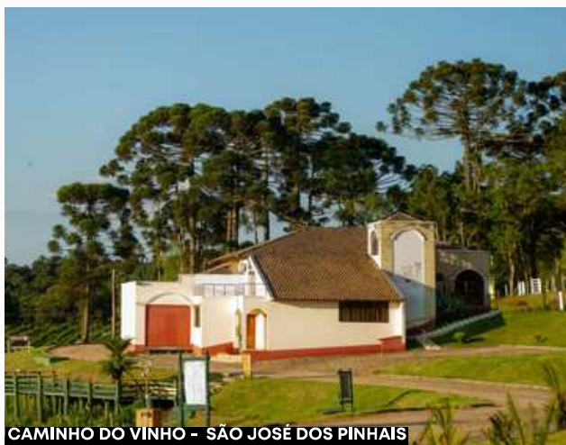
CAMINHO DO VINHO - SÃO JOSÉ DOS PINHAIS

O almoço (não incluído), será em estilo colonial com itens frescos e produzidos pelas famílias locais. Após, haverá uma breve parada compra dos itens coloniais e típicos e ao fim da tarde, retornaremos para Curitiba.